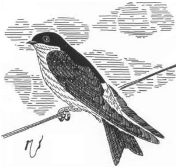
Belorítka Ritka – belorítka domová

Po chvíľke ju dohonal. Už-už sa načahoval, že ju schmatne do ostrých pazúrov, ale akosi sa mu vyšmykla. V pazúroch mu zostal len jej chvostík. Belorítka Ritka od strachu aj zabudla lietať a zletela rovno do prastarej hory pod skalu Čierneho kameňa. Tam sa chvíľku z preľaknutia spamätávala, aby sa odvážila bez chvostíka vzlietnuť.